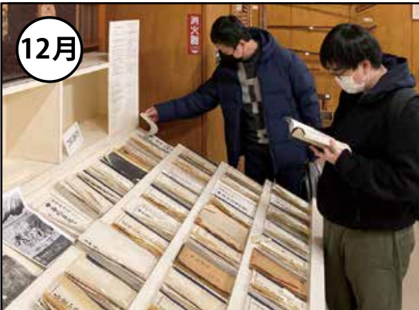
校外学習・冬季休暇(12月下旬～1月上旬)