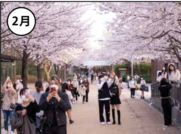
春季休暇(2月上旬～3月下旬)