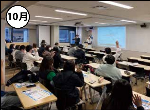
暨南大学学術研究会