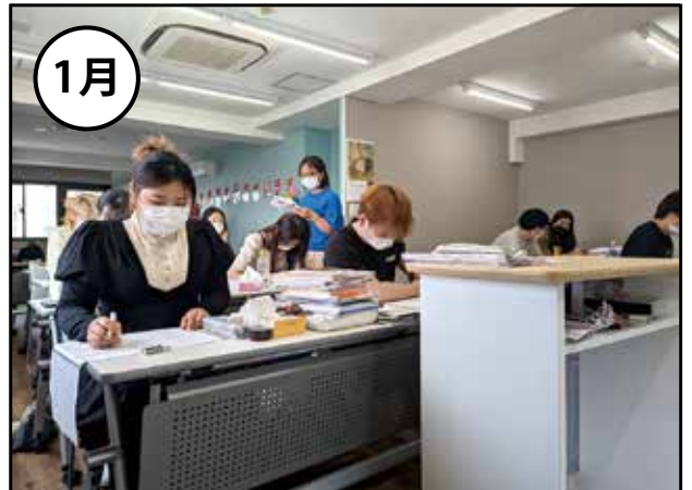
講義再開(1月上旬)・期末試験